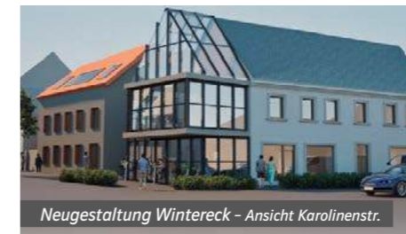
Neugestaltung Wintereck - Ansicht Karolinenstr.