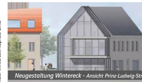
Neugestaltung Wintereck - Ansicht Prinz-Ludwig-Str.