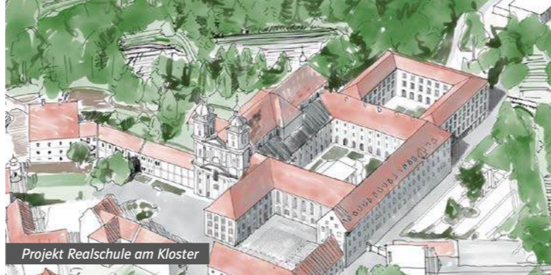
Projekt Realschule am Kloster