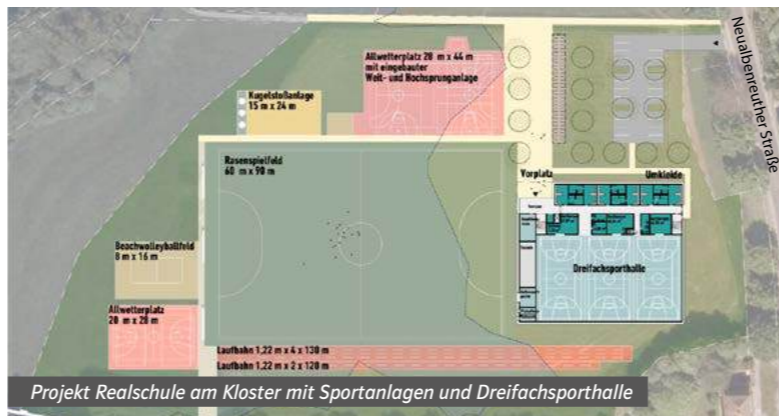
Projekt Realschule am Kloster mit Sportanlagen und Dreifachsporthalle