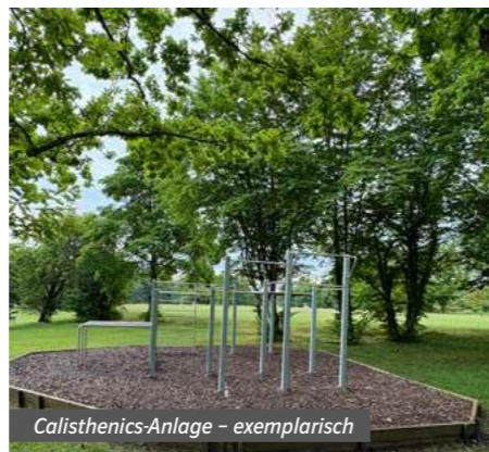
Calisthenics-Anlage – exemplarisch