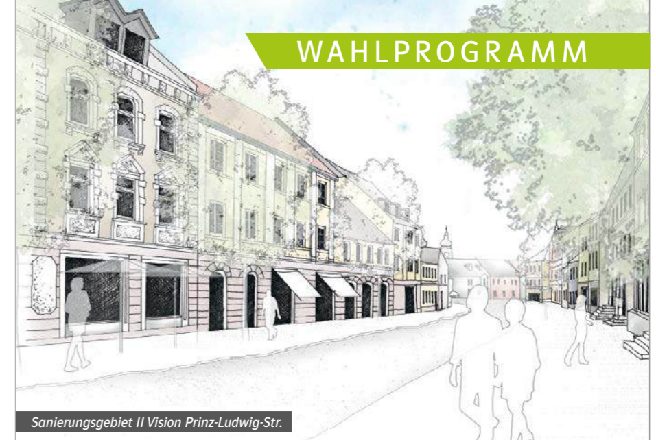
Sanierungsgebiet II Vision Prinz-Ludwig-Str.