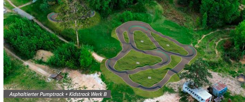
Asphaltierter Pumptrack + Kidstrack Werk B