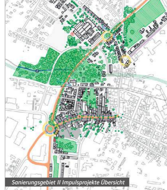
Sanierungsgebiet II Impulsprojekte Übersicht